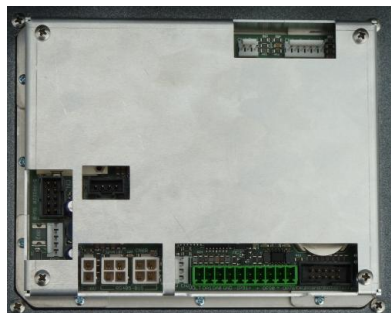
Abbildung 1: Rückseite eines eigerPanels57 mit Aussparungen im Gehäuse für diverse Steckanschlüsse. CN7 ist der grüne Stecker.