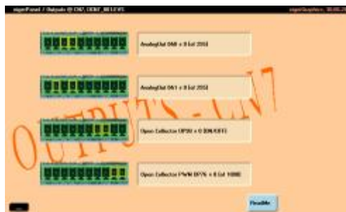
ScreenShot der Applikation OCN7 auf dem eigerPanel70C (WVGA); alle Ausgänge sind inaktiv.

erstellt: 1. Juli 2011 / CA update: 4. Juli 2011 / CA