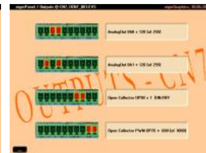
ScreenShot der Applikation OCN7 auf dem eigerPanel57H/C (VGA); alle Ausgänge sind aktiv.